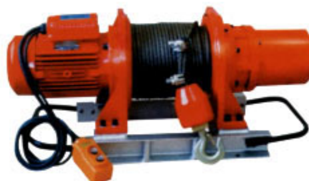
KDJ-500E1, KDJ-750E1 KDJ-1000E1