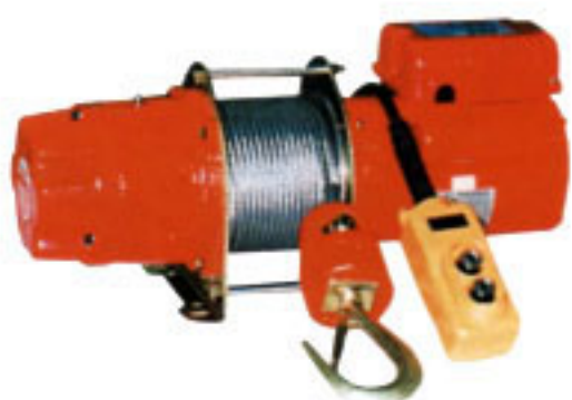
KDJ-200E, KDJ-250E KDJ-300E, KDJ-300E1